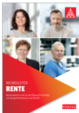
Broschüre DIN A4, Produkt-Nr. 40370-75285

Zentrale Fragen rund um Wiedereingliederung, Rehabilitation, Behinderung sowie Erwerbsminderung werden im Wegbegleiter Gesundheit erklärt und anhand von Beispielen verdeutlicht.