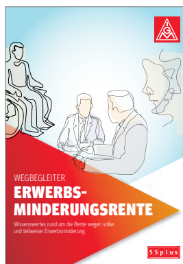
Broschüre DIN A4, Produkt-Nr. 45219-86534

Der Wegbegleiter Rente befasst sich mit allen wesentlichen Vorüberlegungen rund um den Renteneinstieg, den vorgezogenen Renteneinstieg und die jeweiligen Abschläge bis hin zum Thema Besteuerung der Rente sowie Unterstützungsleistungen, wenn die Rente nicht ausreicht.