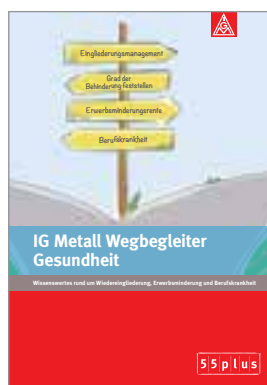
Broschüre DIN A4, Produkt-Nr. 40369-75284

Die zentralen Fragen rund um das Thema Pflege von Angehörigen werden im Wegbegleiter Pflege beantwortet. Er wird durch acht vertiefende Bausteine ergänzt: Teilzeit für Pflegende, Antragstellung und Begutachtung, Pflegebedürftigkeit, Pflegegeld, Kurzzeit- und Tagespflege, Entlastungsbetrag, soziale Absicherung für Pflegende, stationäre Pflege.