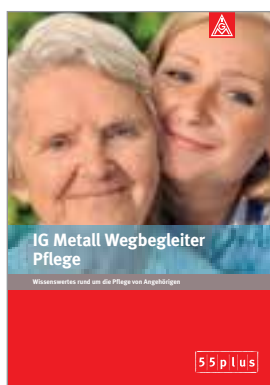
Broschüre DIN A4, Produkt-Nr. 37289-67644

Die IG Metall engagiert sich für sichere Arbeitsplätze, faire Löhne sowie eine gute soziale Absicherung. Sie unterstützt ihre Mitglieder bei Problemen in der Arbeitswelt, aber auch bei weitergehenden Fragen des Lebens. In der Wegbegleiter-Reihe werden Lebens- und Alltagsfragen wie Vorsorge, Rente, Gesundheit oder Pflege aufgegriffen. Die Themen werden übersichtlich aufgearbeitet und Orientierungshilfen gegeben.